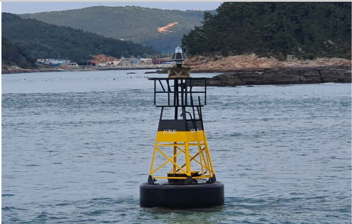
등대(등부표) 설치 전경