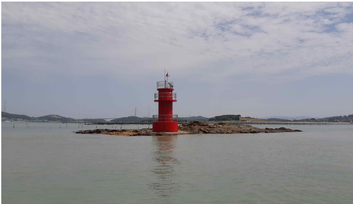
등표 전경 사진