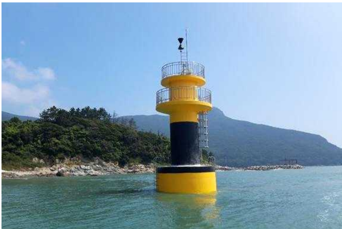
파장각서방등대 설치 전경