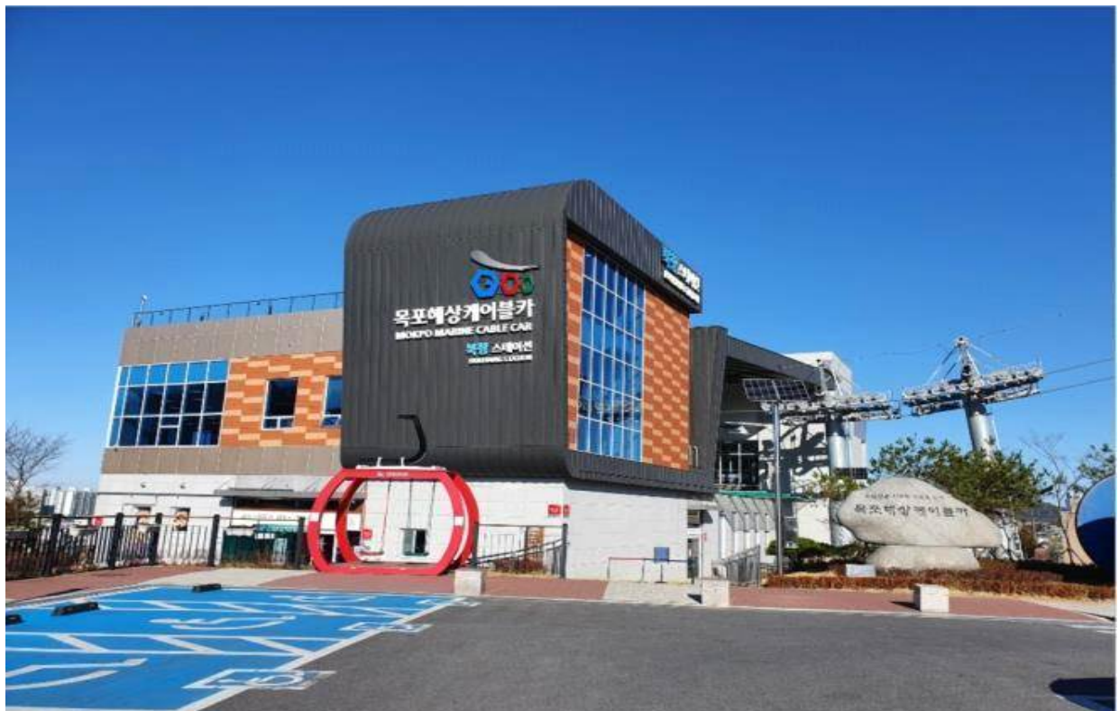
목포해상케이블카 북향탑승장 전경