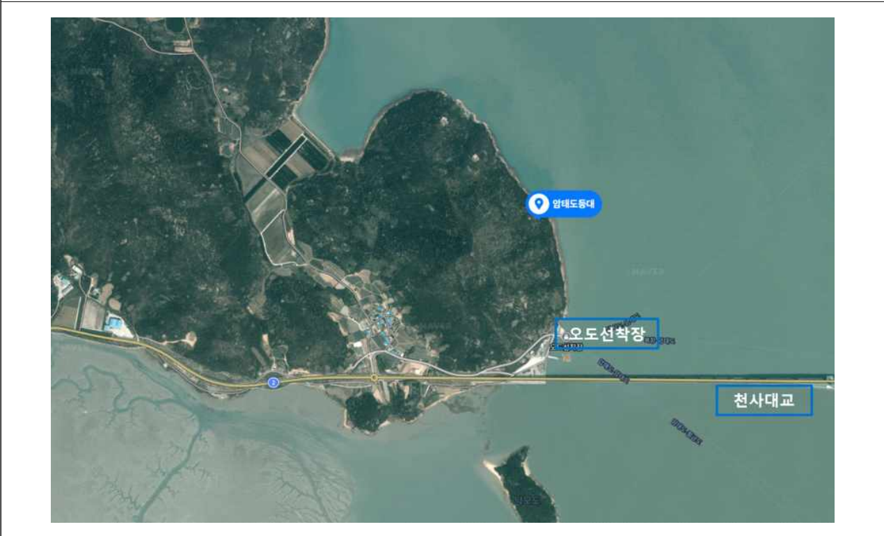
암태도등대 설치 위치도